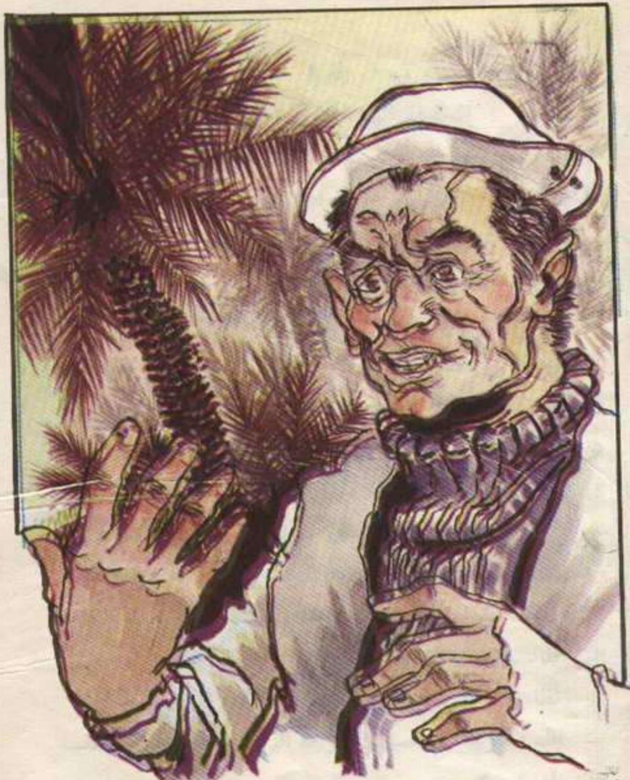
مدّ « زنهار » يده إليها بطريقة فهمتها على الفور . . . كان واضحاً أنه يطلب منها الورقة .

أحكى لكم كل ما حدث بعد خروجكم للصيد وبقائى فى غرفة المكتبة .