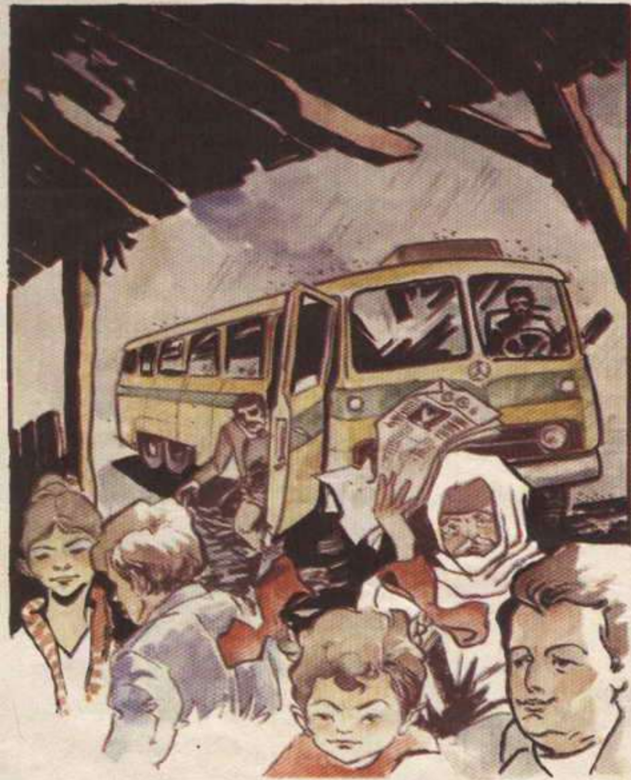
توقف الأتوبيس ، وأعلن السائق أن أى محاولة للتقدم تعتبر مغامرة بأرواح الركاب

فرح الطفلان كثيراً بالورق الملون .. وتركا الطعام وانهمكا فى أكل الشيكولاتة .. أما السيدة العجوز ، فأخذت تعد الشاى على « الكانون » الذى أحاط به الأصدقاء يلتمسون الدفء فى نيرانه المشتعلة وقد غرق كل منهم فى خواطره .. فساد الصمت إلا من صوت المطر المتساقط على سقف العشة .. ولم تمض سوى دقائق قليلة حتى قدمت لهم السيدة