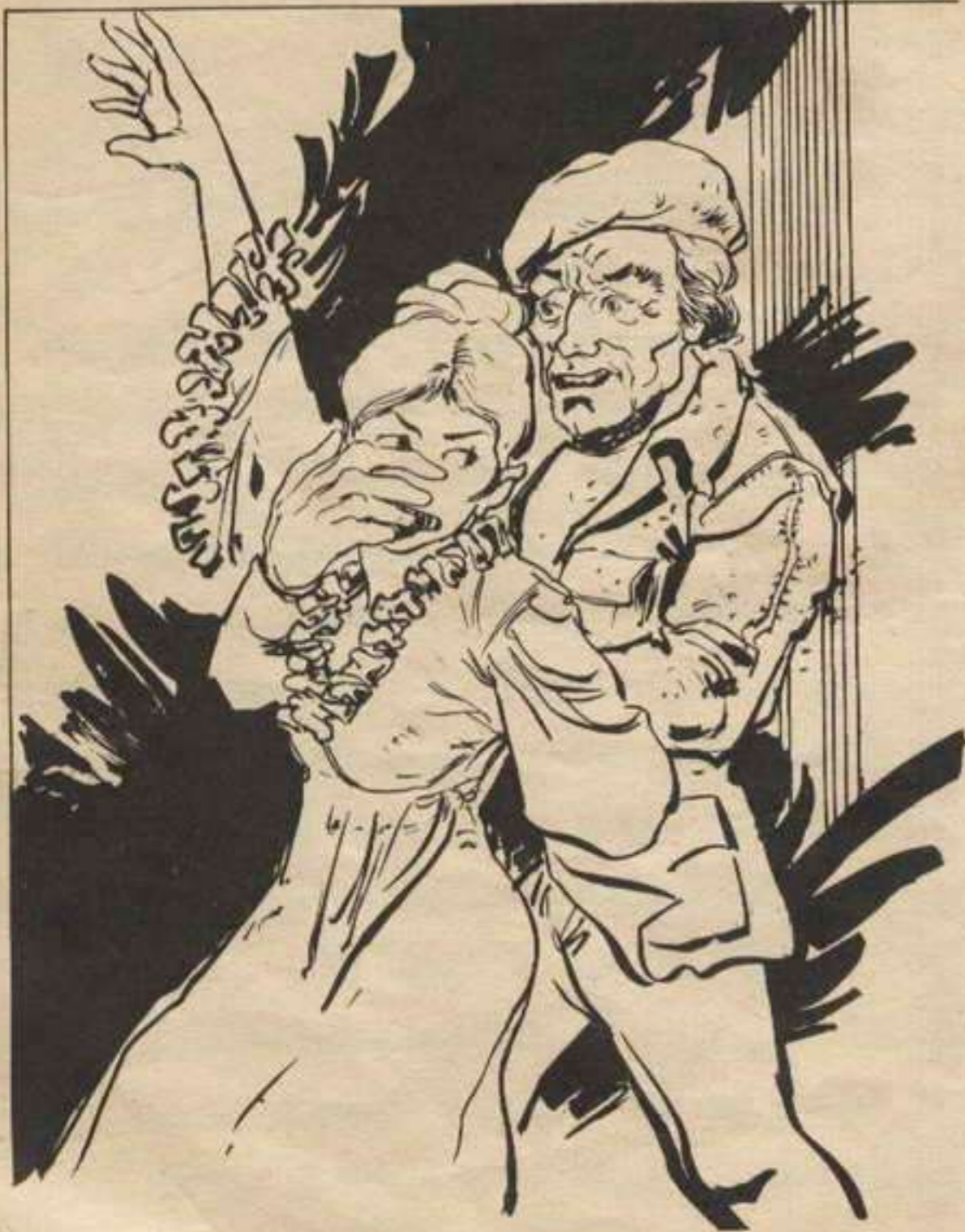
في هذه اللحظة ظهر « مايلز » وانقض كراون على « نوسة » ، وأغلق فمها بيده .

أسرعا بها إلى غابة النخيل . . . وبعد فترة وضعها « كراون » على الأرض . . . وأمرها أن تسير وكان القمر قد ظهر من خلف السحب ، وأخذ يضيء الغابة الساكنة لحظات ثم يختفي وأخرج كل منهما كشافاً ضخماً ، وأضاء الطريق . . . كانا يتبعان خطواتها الواضحة على الرمال . . . وسرعان ماتوغلوا في أحشاء الغابة . . . وكانت « نوسة » تضم « الروب » حول جسمها محاولة اتقاء البرد ، وهي تفكر فيما حدث . . . لقد ضاع كل شيء في ثوان قليلة ، وكان خطأ منها أن تنزل إلى المكتبة وحدها . . . كان يجب أن تعرف أن « كراون » و « مايلز » لن يخسرا المعركة بهذه البساطة . . . كان تتبع الآثار في الظلام شاقاً . . . ولكن « كراون » و « مايلز » كانا مصممين ، وهكذا مضوا رغم الظلام . . .